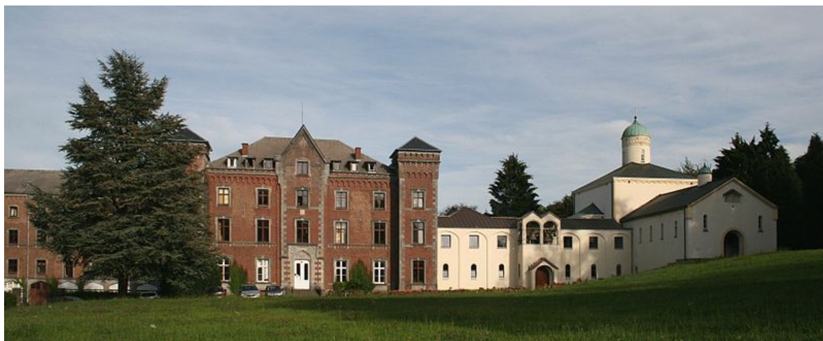
Abbazia di Chevetogne, Belgio

Sì. Sono andato lì perché mi sembrava più vicino a quello che avevo scoperto in Grecia. A dire la verità, sono stato mandato lì. Ero entrato in una abbazia benedettina in Germania. Il mio maestro dei novizi, l'abate, un santo uomo, mi voleva molto bene, e poteva vedere che non ero nel posto giusto. Ha sacrificato un suo novizio promettente e lo ha mandato a Chevetogne, per vedere se questo era più adatto. Quando ho fatto la mia professione monastica è venuto lui stesso a farmi visita. Era un uomo santo. Anche il mio confessore, un monaco trappista, era un uomo santo. Ho avuto la possibilità di incontrare più di un santo uomo, anche in Occidente. Essi esistono ancora.