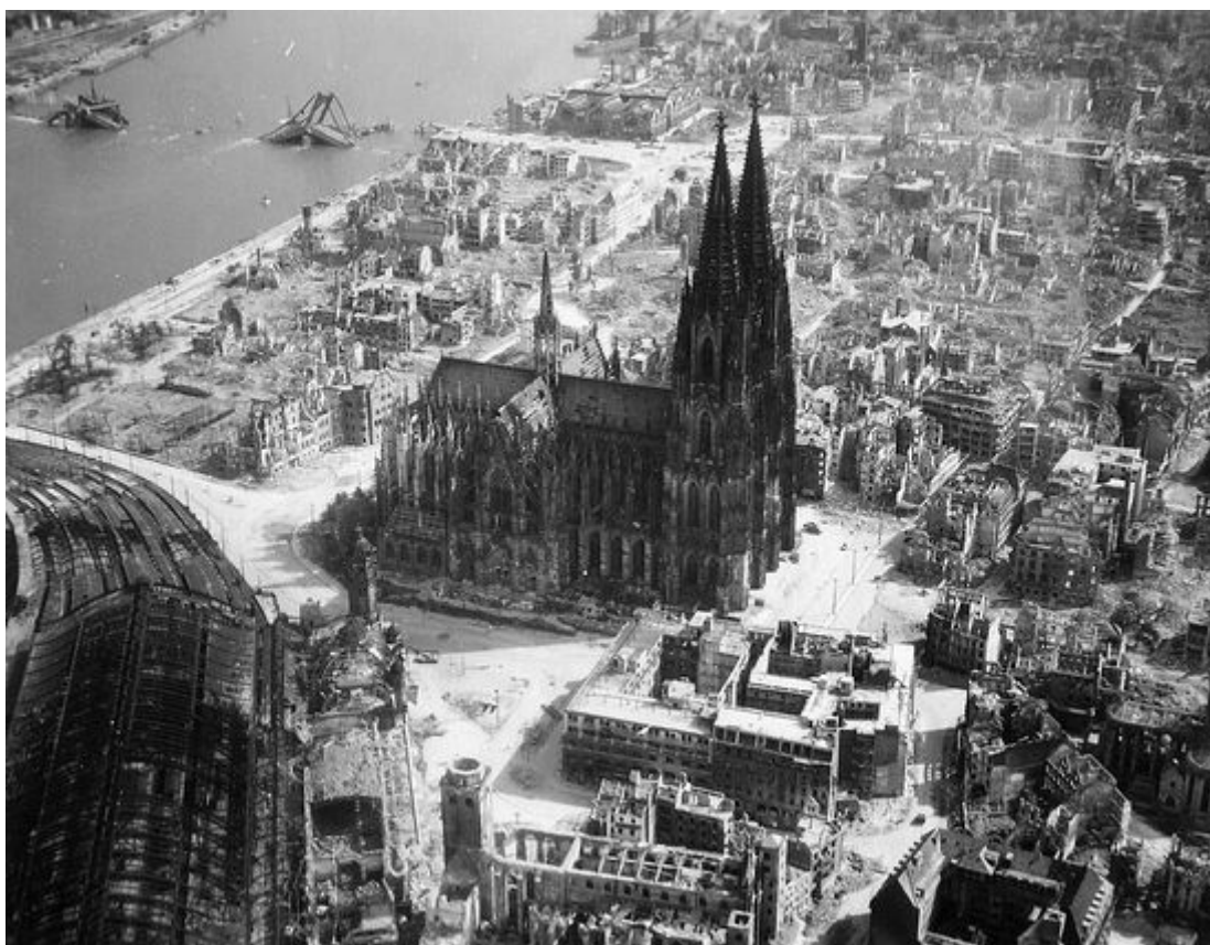
La cattedrale di Colonia durante la seconda guerra mondiale

Sono nato a Colonia, ma abbiamo lasciato quella città quando avevo due anni a causa della guerra. Quella città, antica di quasi 2000 anni, fu quasi rasa al suolo. È stato come a Hiroshima. Circa l'ottanta per cento è stato distrutto, e gli americani hanno anche suggerito di ricostruirla altrove, sembrava inutile cercare di ricostruire quelle ceneri. Ma la gente era molto attaccata alla loro città, la grande cattedrale era ancora in piedi, anche se notevolmente danneggiata. Anche Le dodici chiese romaniche [1] erano state terribilmente danneggiate. Per dieci anni non abbiamo vissuto a Colonia, ma in un piccolo paese nella campagna. Solo nel 1953 ci è stato possibile tornare. Così, ho trascorso la mia gioventù a Colonia, e sono andato lì al ginnasio. Amo ancora molto quella città.