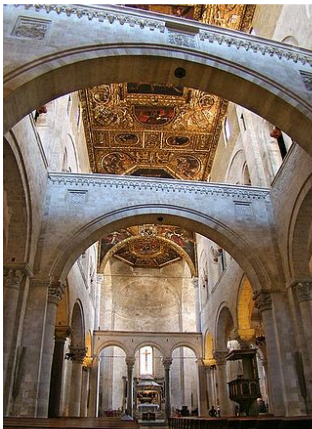
Cattedrale di San Nicola, Bari, Italia

In un certo senso, questa è una cosa fuori dal comune, ma dimostra che molti cattolici non sono più certi di avere ragione.