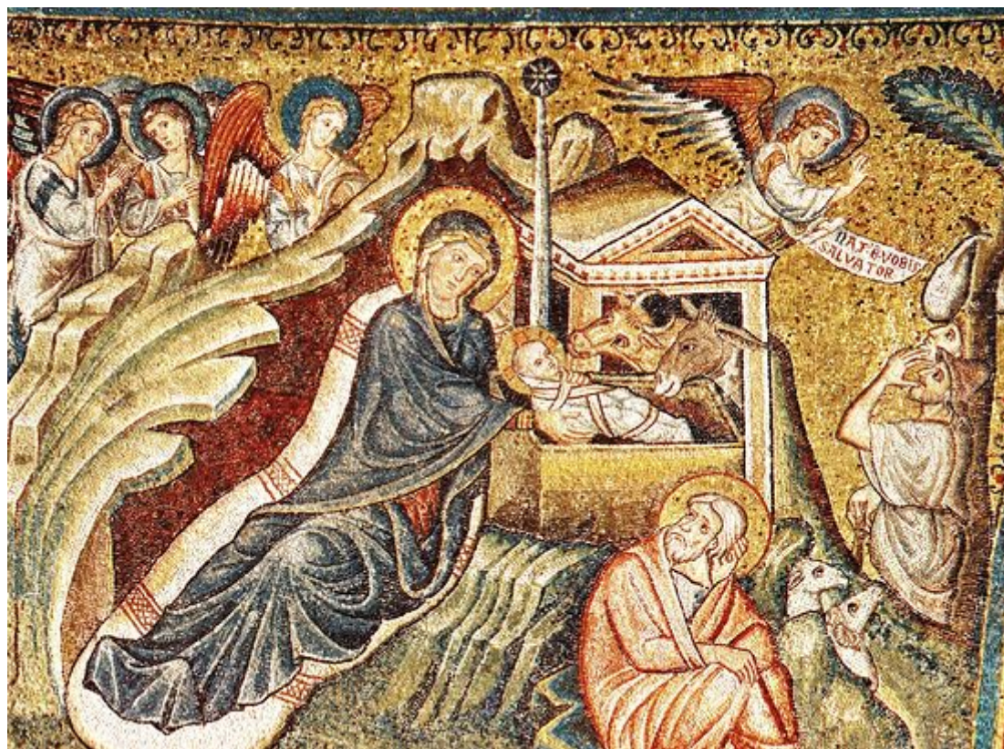
Affresco della Natività di Cristo, Santa Maria Maggiore, Roma

Così, ho dovuto scoprire l'Ortodossia a poco a poco. Quando avevo circa diciannove anni, dopo il ginnasio, [2] sono andato con un amico a Roma, e lì ho scoperto il periodo paleocristiano: le catacombe, le chiese antiche, quelle fondate dai santi Costantino ed Elena, e così via. È stato molto impressionante. Devo confessare che questo ha rafforzato la mia coscienza di me stesso come cattolico. Roma è terra apostolica - qui ci sono la tomba di san Pietro, di san Paolo, Santa Maria Maggiore, Santa Croce, San Giovanni in Laterano... tutte queste chiese paleocristiane, questa incredibile continuità archeologica. Ma molto più tardi ho scoperto che anche se c'è continuità a livello di architettura, non c'era continuità a livello di Chiesa apostolica, il fondamento.