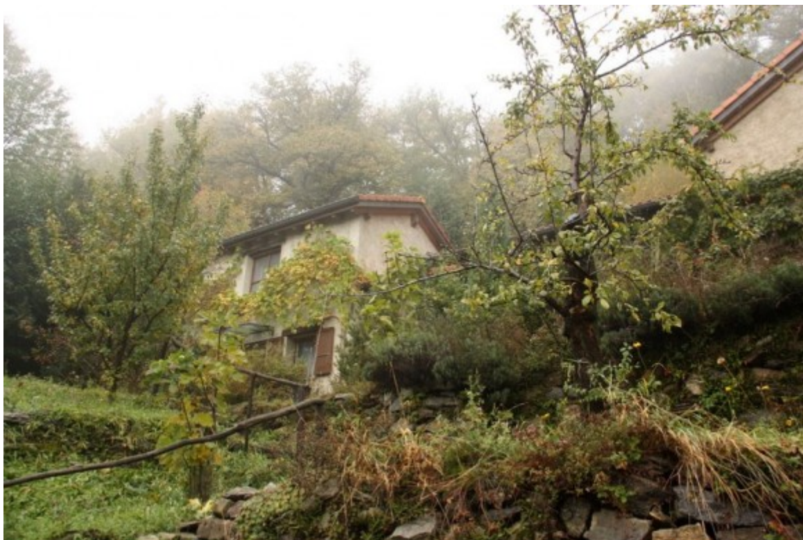
Il monastero della Santa Croce, Roveredo, Svizzera