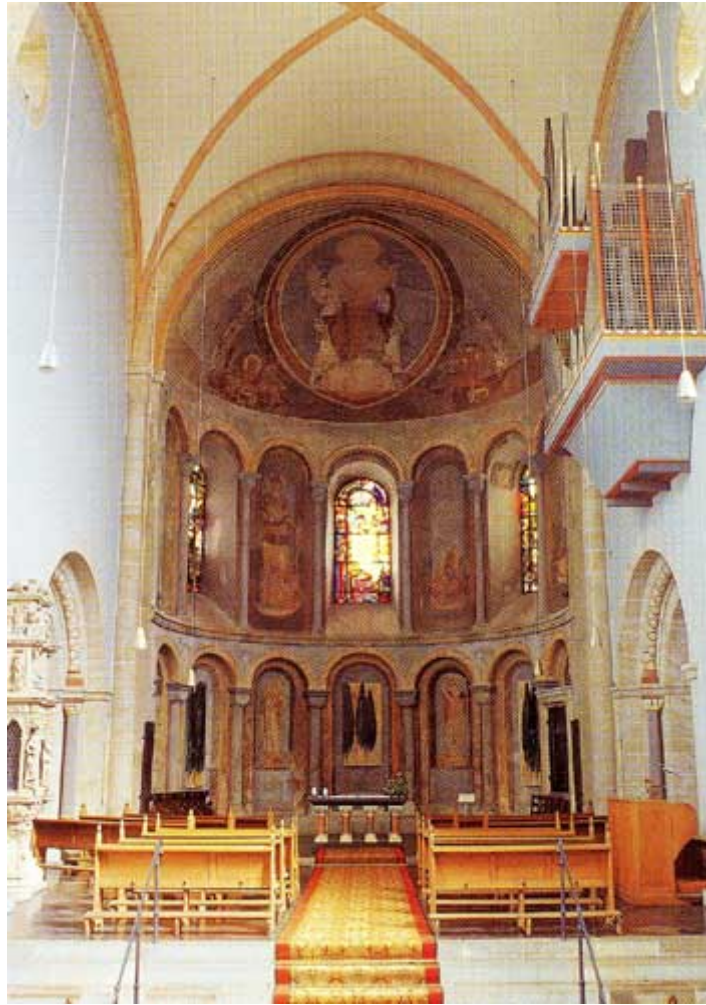
Chiesa di san Gereone, abside

La cattedrale gotica, una meraviglia dell'architettura gotica, fu costruita sul luogo in cui erano state tutte le cattedrali dai primi tempi del cristianesimo. Uno dei primi vescovi di Colonia era uno stretto collaboratore dell'imperatore Costantino. Sotto la torre nord c'è un battistero del IV secolo. Vi è una chiesa di San Gereone a Colonia, dove l'ottagono del battistero è largo fino a cinque o sei metri. È una chiesa romanica, del quarto secolo, e ha reliquie dei martiri romani. C'erano così tante tracce di una Chiesa indivisa, degli inizi del cristianesimo, e da questi fatti molto archeologici, sono stato "spinto" a scavare più in profondità tra le fondamenta della Chiesa. Io sono di formazione uno storico, un numismatico.